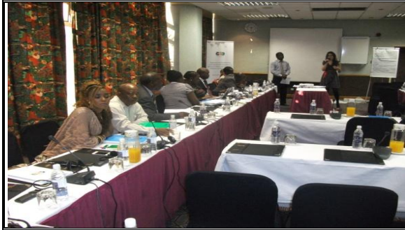
Participants à l'atelier

Dans le cadre du suivi, le Programme ARIAL va assister UCLGA-SARO et les ACL dans l'élaboration et la mise en œuvre des plans d'action pour une implication active dans les dialogues politiques régionaux et nationaux respectivement.